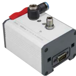
Millimar N 1701 PF Modul für pneumatische Messmittel Stromverbrauch: -32 mA