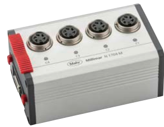
Millimar N 1704 M Modul für induktive Messmittel Stromverbrauch: -170 mA