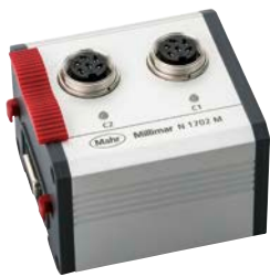
Millimar N 1702 M Modul für induktive Messmittel Stromverbrauch: -110 mA