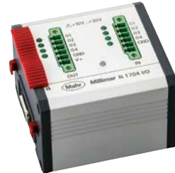
Millimar N 1704 I/O Ein-/ Ausgabemodul Stromverbrauch: -70 mA