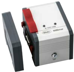
Millimar N 1701 USB USB-Anschlussmodul Stromversorgung: +430 mA