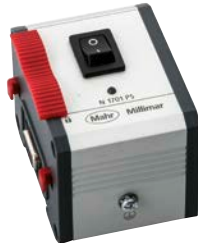
Millimar N 1701 PS Stromversorgungsmodul Stromversorgung: +2000 mA